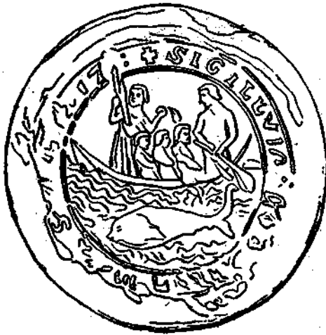
Pesca de la ballena que figura al anverso en el sello del Concejo de Biarritz (1351).

Otro sello de 1297 es del Concejo de Fuenterrabía y muestra en una de sus caras un frágil esquife impulsado por cuatro «arrantzales» en persecución de ballena o cachalote, desde el cual lanzan con éxito dos arpones, mientras en el lado opuesto del sello figura una fortaleza no menos soberbia que la anteriormente citada. En