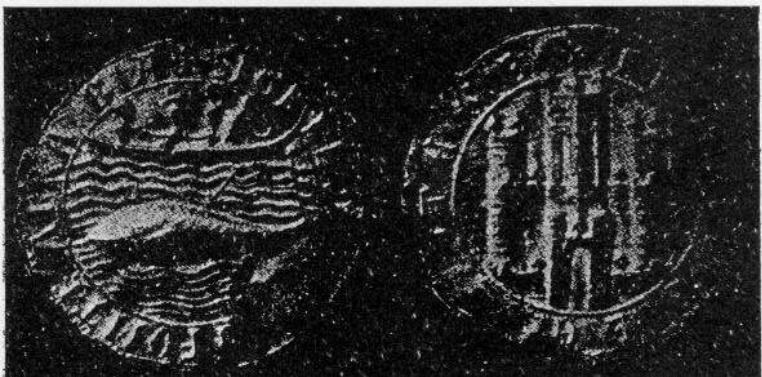
Sello del Concejo de Fuenterrabía mostrando en el anverso una escena de pesca de la ballena y al reverso un castillo (1297).

de Biarritz: «Los sellos de las dos villas bañadas por el Golfo de Vizcaya (Fuenterrabía y Biarritz) nos hacen asistir al espectáculo conmovedor de una pesca de la ballena. Una embarcación rápida,