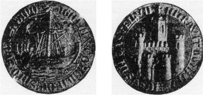
Sello del Concejo de San Sebastián exhibiendo en el anverso un navío comercial y al reverso una fortaleza (1297).

una barca (igual en forma y dimensiones a la del documento de Fuenterrabía), cascarón de tabla que alberga a cinco pescadores bogando en persecución de una ballena. Dumay describe así el sello