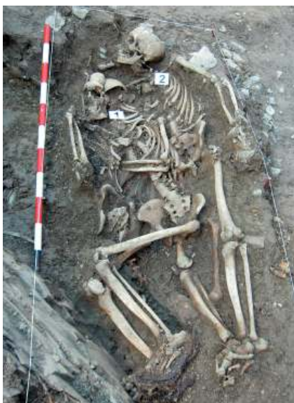
Exhumación en Elgeta en donde se encontraron tres fosas con varios esqueletos que fueron inhumados en 1937.