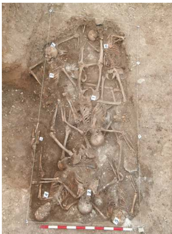
Exhumación en Fustiñana.

Lo cierto es que las exhumaciones han servido para suscitar un creciente interés por esta etapa de nuestra historia y que la guía principal de quienes se implican en estas investigaciones se ajusta al criterio de buscar la verdad como mínimo paso imprescindible para hablar de justicia. O dicho de otro modo, sin la verdad nunca habrá justicia para aquella generación que parece haber quedado en el olvido. En este sentido, las exhumaciones tienen un valor simbólico en su dimensión general y un sentido práctico y humanitario en cada uno de los casos en donde se interviene.