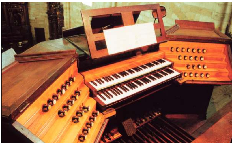
Fig. 6. Aspecto que presentaba la consola del órgano de Usurbil hasta septiembre de 2006. En la misma puede apreciarse la pieza de madera que cubre el lugar donde se ubicaba el tercer teclado manual con el que se gobernaba el Recitativo . A ambos costados de los teclados manuales, puede apreciarse asimismo la distribución escalonada de los tiradores de los registros que se mantuvieron desde que el órgano fue montado en 1920 por Fernand Prince. Tanto en los frentes de los escalonamientos del lado derecho como del izquierdo existen unas chapas de madera que tapan los agujeros donde se alojaban los 23 tiradores que fueron anulados. Al destornillar dichas chapas se puede comprobar fácilmente que la consola dispuso originalmente de 64 tiradores, dos de los cuales estaban destinados respectivamente al control de los trémolos del Positivo y del Recitativo . Si contabilizamos los registros citados en la Enciclopedia Lavignac junto con los del contrato de compraventa, sólo llegamos a un total de 45, faltando todavía otros 17 para llegar a los 62 que existieron en origen.

1907. –BIDART, baron de l’Espée: 62 jeux, sur 3 claviers et pédale. - Construit par Ch. Mutin-. En dehors des registres de l’orgue cet instrument possède 3 célestas, 1 clavecin et 1 piano, qui peuvent être joués sur le premier clavier, avec annulation rapide des registres tirés, pour le cas où l’on voudrait se servir de ces jeux en solo. Un petit clavier de 26 touches, placé au-dessous du premier, commande 26 instruments accessoires, tels que: timbales, cymbales, grosse caisse, triangle, gong, castagnettes, etc. pourvus du mécanisme nécessaire pour les actionner aux cadences voulues. Cet orgue possède, en outre des pédales de combinaison ordinaires, 5 combinaisons ajustables sur tous les jeux. On a fait usage pour la première fois, dans cet instrument, de jeux absolument nouveaux comme timbre, tels: cor harmonique, cor anglais et musette, viole et jeux mordants, à plusieurs harmoniques, pour imiter le quatuor 23 .