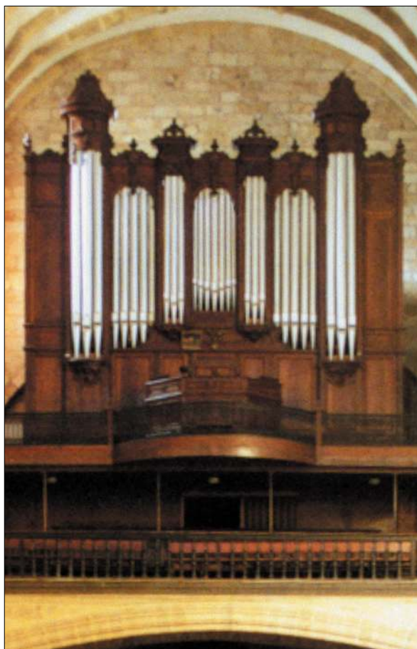
Fig. 7. El coste del desmontaje del órgano en Ilbarritz, su traslado, y su colocación en Usurbil fue de 15.250 pesetas. Desde entonces, y hasta 1936, el instrumento fue atendido por Fernand Prince. En 1966 la casa Amezua y Cía. de Hernani llevó a cabo una intervención en la que se eliminó el registro de Unda Maris 8', y se colocó un LLeno de 3-4 hileras en su lugar. En 1987, los organeros Bernal y Korta de Azpeitia volvieron a introducir nuevas modificaciones con objeto de ofrecer otras posibilidades tímbricas. En la actualidad, el órgano está siendo reconstruido por el organero francés Denis Lacorre.

las monjas benedictinas de Urt no encaja con la información procedente del contrato conservado de Usurbil. De los 14 registros que quedaron en posesión del doctor Bastide, sólo 11 llegaron a quedar instalados en el órgano de su propiedad. Es obvio que cuanto más intentamos profundizar, surgen otras cuestiones difíciles de explicar que se suman a aquellas que ya venimos arrastrando desde un primer momento. Aparentemente, no existe ningún problema a la hora de señalar qué registros procedentes del órgano de Ilbarritz podrían encontrarse en el órgano del monasterio de Urt. Tanto el Recitativo como el Pedal quedarían completados por una parte de los registros que se indican en el contrato de