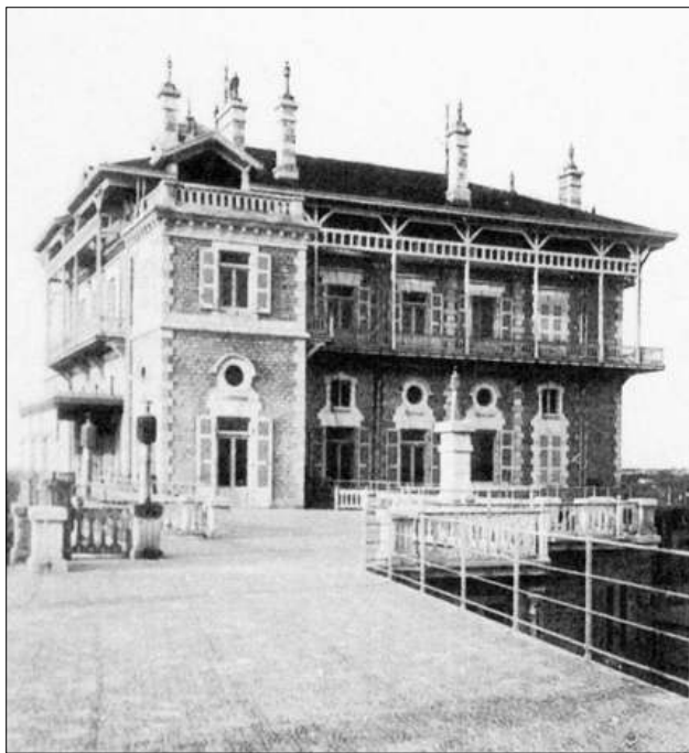
Fig. 2. En 1890 el barón Albert de l'Espée mandó construir un gigantesco órgano a Aristide Cavaillé-Coll, para el cual haría edificar una gran mansión en Ilbarritz. Hacia finales de 1897 el monumental órgano de 4 teclados y más de 70 registros quedaba instalado dentro de la nueva mansión. Apenas un año después de su instalación, el Barón ponía a la venta la mansión y el órgano. Los operarios de Charles Mutin desmontaron el instrumento para ser trasladado después, en 1903, a la basílica del Sacré-Cœur de Montmartre. Posteriormente, tras renunciar a la venta de la mansión, en 1905 el Barón de l'Espée volvió a encargar a Mutin otro órgano de 62 registros, el cual fue comprado en 1920 en su mayor parte por la Iglesia del Salvador de Usurbil. Este instrumento fue diseñado para adecuarse lo más fielmente posible a las adaptaciones y transcripciones organísticas del repertorio operístico wagneriano.

cuales se conservan tres: uno construido por Cavaillé-Coll en 1894 para su residencia de París, actualmente en la iglesia de Saint-Antoine des Quinze Vingts; y los otros dos citados anteriormente reubicados respectivamente en la basílica del Sacré-Cœur de Montmartre y en la iglesia parroquial del Salvador de Usurbil. Este último puede clasificarse como un órgano de estilo romántico-sinfónico francés, a pesar de que en su día mantuviera ciertas características que marcaban sus diferencias, dado que se trataba de un órgano excepcional tanto por su concepción original como por su historia.