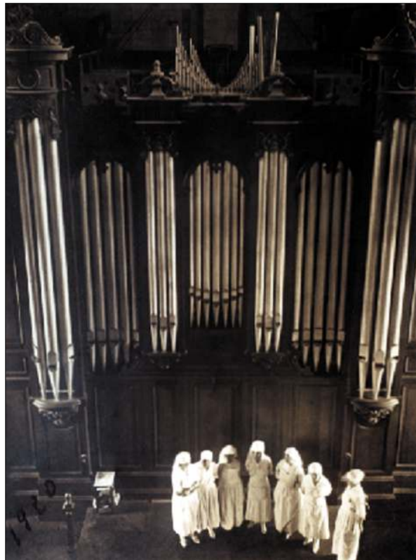
Fig. 5. Aspecto que presentaba el órgano del barón de l'Espée en su antiguo emplazamiento de la mansión de Ilbarritz, poco antes de ser vendido definitivamente a la Parroquia de Usurbil. En la zona superior puede apreciarse una parte de la tubería interior. Abajo, un grupo de enfermeras y el año en que fue tomada la foto, 1920, cuando la edificación todavía funcionaba como hospital.

la Côte Basque . Esta sociedad fue la que realmente se hizo con dichas propiedades, y, además de la mansión y el órgano, adquirió una extensión de terreno de 60 hectáreas y 1,5 Km. de playa para explotarlos económicamente. Tras la venta de la mansión, la alta sociedad de Biarritz y París tuvo la oportunidad de disfrutar –entre otras cosas– del espectacular órgano de salón, privilegio que estuvo reservado exclusivamente hasta entonces a su anterior propietario. El 10 de abril de 1912, tuvo lugar un concierto organizado por los señores de Poliakoff y de Cheigné, en beneficio de la aviación militar, del que se dice que todo el mundo oyó hablar en su día. Era la primera vez que la extraña mansión se abría al público. Los invitados pudieron escuchar en aquella ocasión “un admirable concierto” en el que participó la célebre cantante de ópera Fédia Litvine. De la noche a la mañana surgió una repentina e inquietante curiosidad entre la alta sociedad de Biarritz, y la mansión fue “invadida” por la multitud más elegante y selecta. Hay constancia de que en los patios se llegaron a contar alrededor de 150 automóviles y carruajes tirados por caballos, y que en menos de una hora se recaudaron