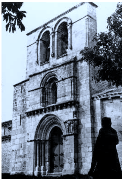
Casa Manipel. Santuario de Estíbaliz. Espadaña románica. (s.XII). c. 1970.

En la década de los años 70, tanto la Casa Manipel, como Ediciones Sicilia de Zaragoza comenzaron a imprimir tarjetas en blanco y negro de diversos Conventos y Monasterios benedictinos del País Vasco, como Leyre y Estíbaliz, de gran calidad y pretensión artística. Tímpanos, portadas y ábsides se presentan con claros enfoques y planimetrías cultas. La calidad del blanco y negro queda fuera de toda duda, lográndose postales de gran sobriedad y fuerza plástica.