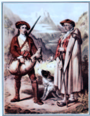
Chasseur et Berger en 1830

Chatagneau. Pays basque. Vieilles Gravures. Chasseur et Vieux berger en 1830. Editada en 1995.