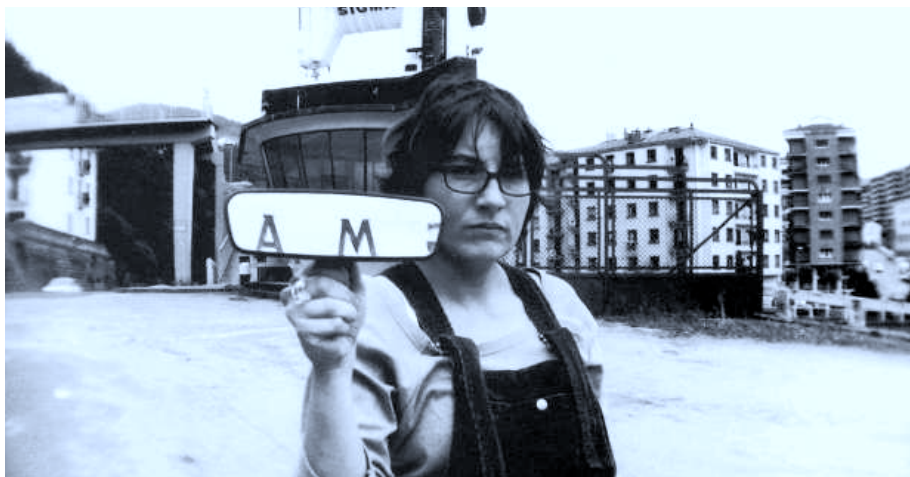
Ongarri. Elgoibar. Carol Sánchez. Elgoibar. 1999.

Pero también las instituciones religiosas han utilizado la postal como medio de propaganda de sus principales figuras, hitos y monumentos artísticos. Ahí están las efigies de Ignacio de Loyola realizadas por Coullat Valera y fotografiadas por G. de León, S.I., o la Francisco de Javier, reproducida de un cuadro del mismo Castillo. O las imágenes de la Virgen de Itziar, fotografiada por Javier Carballo y reproducida por Malpica de Zaragoza, o el Cristo inacabado de Julio Beobide fotografiado por Gar de Zarautz y difundida por el Museo Beobide de Zumaya, o las ingenuas y sueltas arquitecturas de la Abadía de Belloc de Urt trazadas y coloreadas con acuarela por el benedictino P. Marc y editadas por Ezkila en 1994.