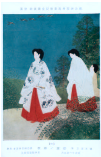
Postal japonesa.

Pero una vez consumido y usado el icono-postal como ventana y horizonte emblemático abierto al mundo durante algún tiempo, la postal es guardada en el cajón del armario o en la caja “ad hoc” acomodada en cualquiera de los apales o estantes del armario-biblioteca. La postal pasa así a formar parte de la colección de postales, generales o monográficas, ordenadas o desordenadas, que resisten muchas veces el paso del tiempo y hasta de siglo. Hasta que un buen día van al cesto de papeles, o lo que es mejor, a engrosar las cajas del coleccionista amigo o las del vendedor de rastro o el rastrillo. Y aparece así la “cartofilia” y el coleccionista ávido de encontrar la pieza adecuada y precisa. Yo he sido uno de ellos y por eso se lo que me digo.