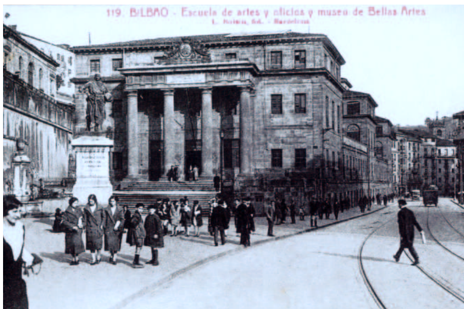
L. Roisin. Bilbao. Escuela de Artes y oficios y Museo de Bellas Artes. c. 1910.

Como hemos indicado con anterioridad es entre 1903-1910 cuando comienza a desarrollarse la postal turística como paisaje urbanita y ciudadano tal como la entendemos hoy en día. Paisaje urbano de San Sebastián, Bilbao y Vitoria captado con fruición y con deleite en sus principales puntos neurálgicos y emblemáticos. Otro tanto sucede con poblaciones turísticas o típicas como Ondárroa, Lekeitio, Lezo, Irún, Hondarribia, Zeánuri, Amorebieta, Durango y Lemona.