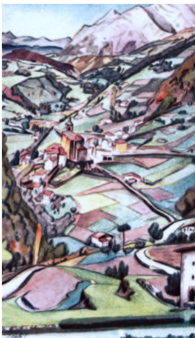
Carlos Landi. Paisaje de Régil. 1925-30.

Pero ya con anterioridad a la Guerra Civil Española, Industrias Gráficas Laborde y Labayen de Tolosa había impreso algunos de los mejores carteles y colecciones de postales de la primera mitad de este siglo. Ahí está el caso de la espléndida colección de postales realizadas entre 1925-30, compuesta de 12 ejemplares diseñados por el dibujante y pintor Carlos Landi (1896-1974) y que ofrecen paisajes de San Sebastián, Pasajes de San Pedro y San Juan, Tolosa, e Ibarra, así como diversas escenas de fiesta y trabajo, trazadas con un realismo no idealizado a base de encuadres fotográficos y colores fauvistas (rojos, verdes, ocre y negros) a la manera de Arteta, Tellaetxe, y Olasagasti. Ya para 1928, se utilizarán algunas de estas postales en Cartas gastronómicas del Campo de Golf, en las que se aprecian las abundantes y copiosas comidas de la época a base de seis platos, postres, vinos y licores.