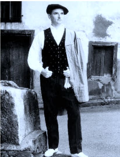
Ikerfolk. Donostia. Atondu. Fotografía Lamia. 2000.

Muy cuidada y trabajada es también la colección de postales editada por Ikerfolk de Donostia el año 2000 sobre Trajes del País Vasco fotografiados por Lamia Argazkintza bajo la dirección de Juan Antonio Urbeltz y Ane Albisu.