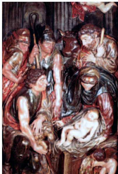
Fundación Pakea. Tarjeta postal navideña. Bernabé Imberto. El nacimiento de Cristo. Relieve del retablo de la Virgen del Rosario de la Parroquia de San Pedro de Mañeru (Navarra).

Otro tanto podemos decir de la colección de tarjetas postales Navideñas que la Fundación Pakea de Gipuzkoa ha venido enviando a sus clientes y