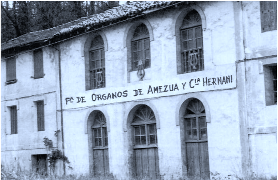
Fábrica de Organos de Amézua y Cía. (Hernani)