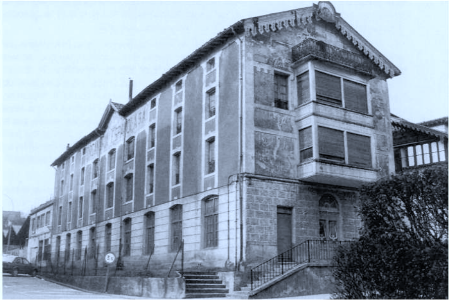
Organería Española (O.E.S.A.) Azpeitia