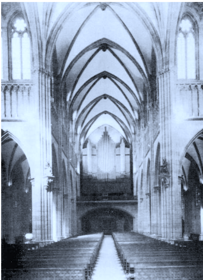
Organo del Buen Pastor de San Sebastián.

La instalación de todo el órgano se efectuó en alto, dejando libre todo el coro, en 3 plataformas de cemento armado. En la primera están el primero y segundo teclado y gran parte del pedal, con todos sus aparatos consiguientes. En la segunda, el tercero y cuarto teclados con sus cajas expresivas respectivas, y todos los juegos pequeños del pedal, con sus Reguladores y aparatos consiguientes. Y en la tercera, el quinto teclado libre, con una batería de lengüetería de 5 juegos en llamada, posición horizontal, però en su interior. Cuenta por lo tanto este órgano con 105 juegos efectivos, con dos de 32 pies, que, unidos a ellos los 19 del órgano del coro bajo forman un conjunto de 125 juegos efectivos de que puede disponer el organista en la consola grande del coro alto, pudiendo tocar el del presbiterio, instalado en una galería alta, como órgano de 'Ecos', bien en el primer teclado 6 en el quinto por medio de dispositivos. Tiene también el organista a su disposición, además de la registración normal, octavas graves y agudas, varias combinaciones fijas y 4 combinaciones ajustables.