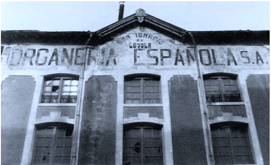
Organería Española (O.E.S.A.) Azpeitia

Nuevamente no me equivoquè, eran tiempos de euforia alemana por lo que todo hacía presumir un final victorioso en la guerra, y como buen alemàn de su tiempo, creyò más conveniente renovar su contrato con la casa Walker mejoràndolo -esto es una suposición mía- haciendo valer la oferta de Organería. Constituida legalmente la Organería Española S.A. se tuvieron varios ofrecimientos de organeros que tuve que sortear buenamente, ya que el propòsito principal era obtener un buen rendimiento de lo que, poco más ò menos, estaba en la ruina. De ellos se llegó a una inteligencia con el taller de tubos de la Vda. de Estadella en Barcelona pasando éste a depender de la Organería con