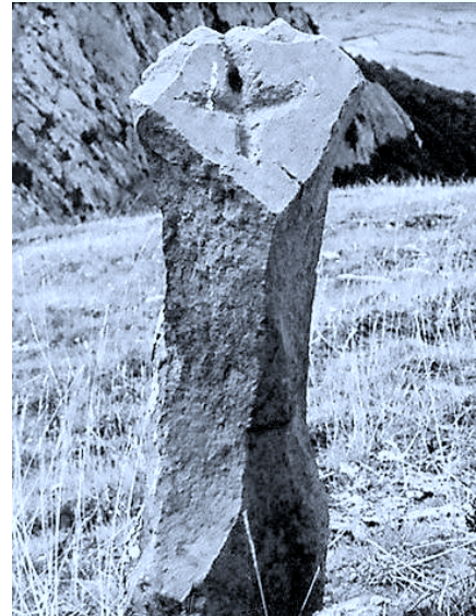
Lámina – II: Mojón de término del valle de los Redondos en Palencia.

cristianización de lugares paganos, simples marcas de fé (Fig.1,2), etc.. Es interesante hacer notar como en el complejo arqueológico de época medieval de La Peña de San Pantaleón (La Puente del Valle, Cantabria) -ss.VII-XIII- que venimos excavando desde hace años (FERNÁNDEZ et alii. , 2003), contamos con tres ejemplares de cruz grabada que