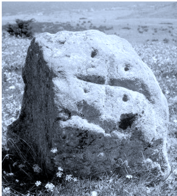
Lámina I: Piedra de término (San Vitores, Cantabria) que presenta grabado el más clásico de los símbolos de demarcación, la cruz con los cuatro puntos.