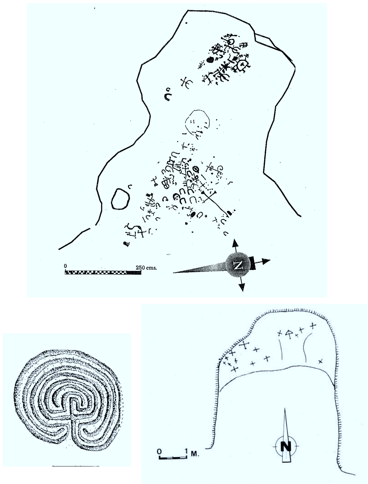
Figura – 3: 1.- Abrigo de La Calderona (Berzosilla, Palencia) (seg. RINCÓN VILA), 2.- Laberinto de la iglesia de San Pantaleón (Arcera, Cantabria), 3.- Covacha de Las Presillas de Bricia (Torrecilla, Burgos) (sg. FRAILE LÓPEZ).