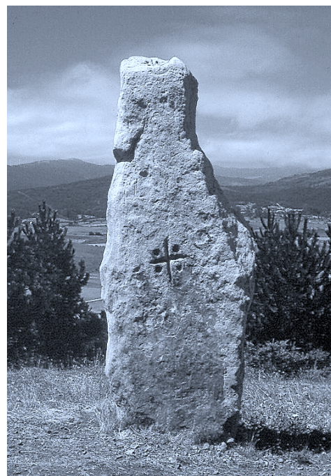
Lámina III: Menhir de Piedrahita con marca de término (Valdeolea, Cantabria).