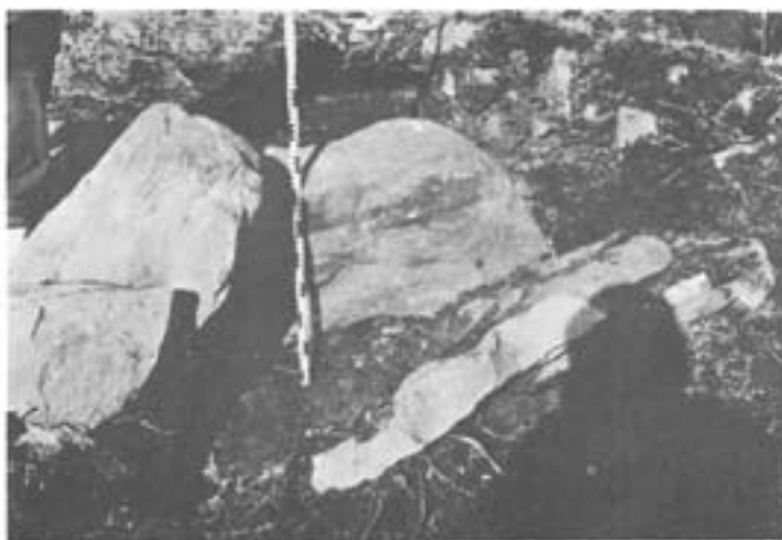
Fot. n.º 2