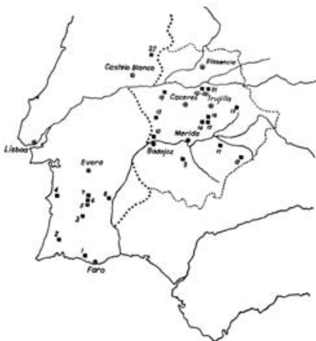
Figura 1. Dispersión de los hallazgos conocidos hasta la fecha, de las estelas grabadas extremeñas. Los números coinciden con los hallazgos: 1 Figuera. 2 Monchique. 3 Aurique. 4 Santiago de Cacem. 5 Santa Victoria. 6 Ervidel. 7 Beringel. 8 Mombeja. 9 Arroyo Bonaval. Almendralejo (Badajoz). 10 Granja de Céspedes (Badajoz). 11 Magacela (Badajoz). 12 Cabeza de Buey (Badajoz). 13 Tres Arroyos. Alburquerque (Badajoz). 14 Cerca de la Cabeza. Santa Ana de Trujillo (Cáceres). 15 El Oreganal. Robledillo de Trujillo (Cáceres). 16 Santa María de la Jara. Ibahernando (Cáceres). 17 Solana de Cabañas. Logrosán (Cáceres). 18 Dehesa de las Puebas. Brozas (Cáceres). 19 El Oreganal. Torrejón del Rubio (Cáceres). 20 El Oreganal. Torrejón del Rubio (Cáceres). 21 Huerta de la Cava. Torrejón del Rubio (Cáceres). 22 Meimoa. Penamacor. Castelo Branco.