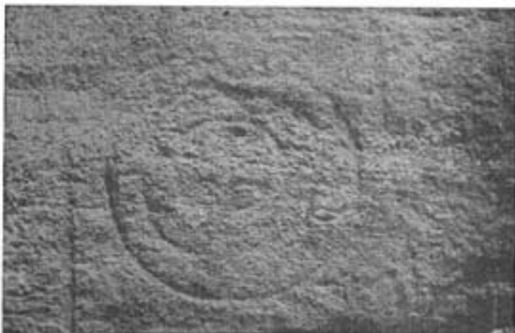
Lámina I. Estela de Granja de Céspedes. Museo Arqueológico Nacional.

cería otro interés especial esta losa que sólo viene a enriquecer con un documento más la serie de las estelas grabadas extremeñas que conocemos, y que se han venido hallando hasta el presente tanto en España como en Portugal, pero los descubridores y conservadores de este monumento hasta su ingreso en el Museo Arqueológico Nacional nos han conservado un dato de gran interés científico y cultural y que nos faltaba en relación con todas las demás estelas extremeñas siempre recogidas casualmente.