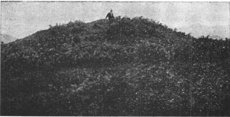
Fot. 2. Dolmen de Diruzulo .

En el centro de la cámara (X, fig. 2) hay un hoyo artificial hecho en la roca natural (ofita) del subsuelo que mide 1,10 de largo, 1,10 de ancho y 0,50 de alto. Este hoyo asimila el dolmen de Diruzulo a algunos de la sierra de Elosua-Plazentzia (Aranzadi, Barandiarán y Eguren: Exploración de diez y seis dólmenes de la sierra de Elosua-Plazentzia. San Sebastián, 1922).