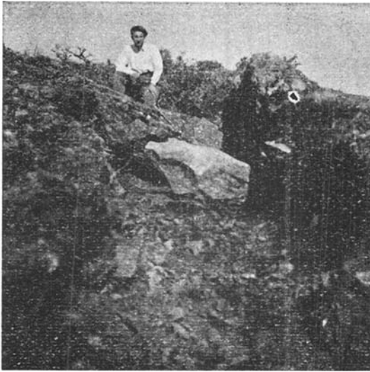
Fof. 3, Dolmen de Diruzulo después de excavado.

En el collado de este nombre, situado al NE. del pico de Kalamua , existe un montículo de piedras, cuyo diámetro y altura miden 7 metros y 0,60 respectivamente. En el centro tiene un