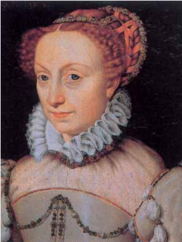
Joana Albretekoa, Nafarroako erregina (1528-1572). François Clouet-en erretratua.