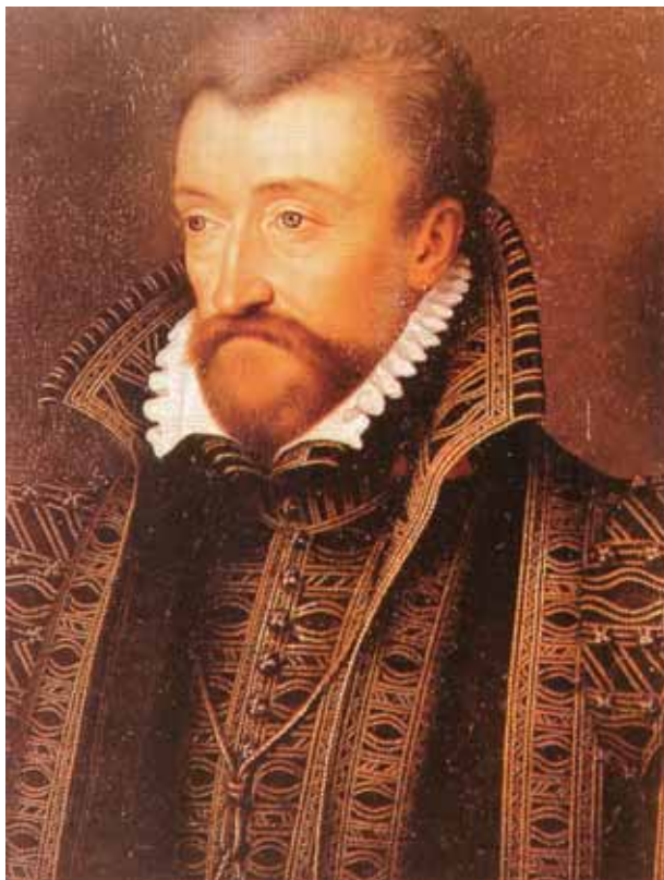
Anton Bourbongoa, Nafarroako errege ezkontidea (1518-1562).