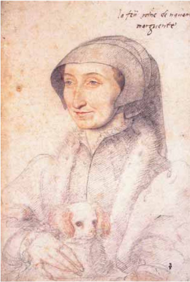
Margarita Nafarroako erregina (1492-1549). François Clouet-en (?) marrazkia.