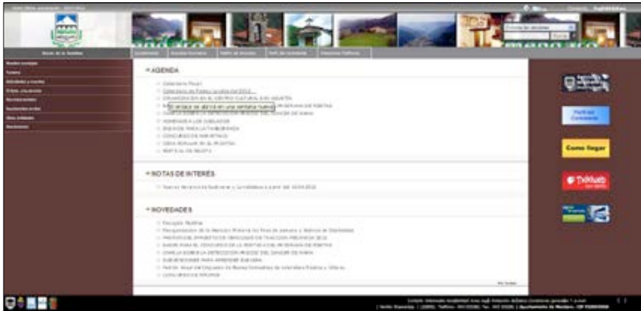
Web del Ayuntamiento de Mendara.

En relación a la información turística, está presente en todas las webs y de manera muy elaborada: incluyen información sobre el patrimonio, monumentos, gastronomía, alojamiento, rutas, etc. Como elementos que pueden destacarse, el Ayuntamiento de Mendara incluye en esta sección entrevistas a personas que residen en el municipio; Mundaka un planificador de viajes.