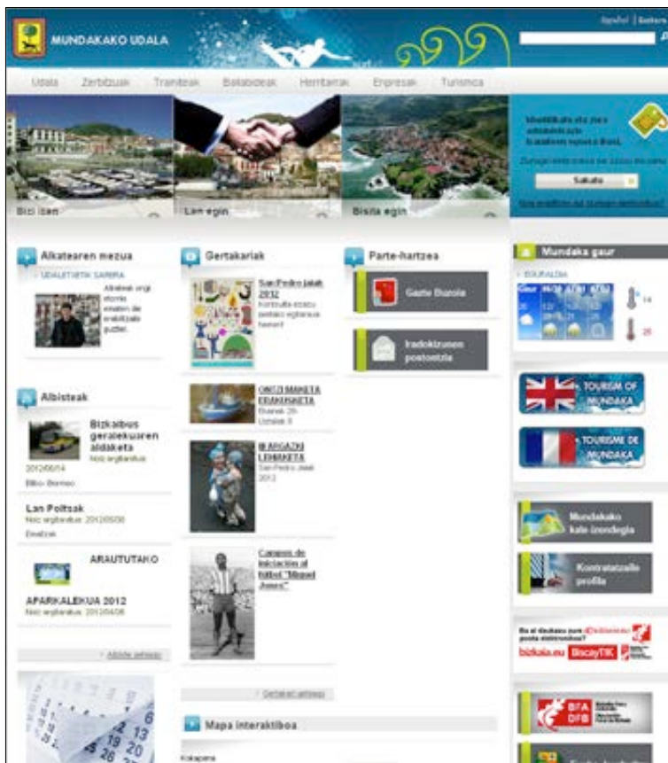
Web del Ayuntamiento de Mundaka.

Ninguna de las webs publica un medio municipal, y sólo Artziniega enlaza con medios de comunicación (con Diario de Noticias de Álava ). No habilitan botones para relacionarse con medios (sala de prensa o similares), ni recogen noticias publicadas sobre el municipio; tampoco hacen constar presencia alguna en redes sociales.