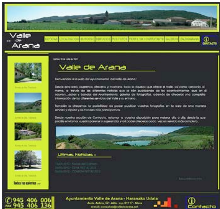
Web del Ayuntamiento de Valle de Arana/Harana.