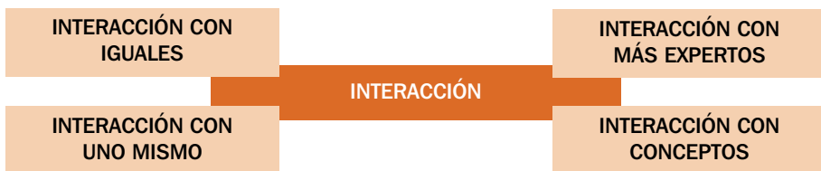
Figura 2. Tipos de interacción según van Lier, 2004.

En el esquema de van Lier aparecen diversos tipos de interacción que, en relación con la mediación que promueven, podríamos agrupar dentro de dos grandes bloques: la mediación metacognitiva y la cognitiva (Karpov, 2003). La mediación metacognitiva (donde se sitúa la 'interacción con uno mismo' y en parte la 'interacción con otros') está relacionada con el discurso interior y la autorregulación. En su libro Thought and Language (1986), Vygotsky se refiere al discurso interior como una forma de diálogo con uno mismo; su función principal reside en dar forma y controlar los pensamientos propios, razonar, planificar una acción, regular el comportamiento, resolver problemas, recordar, etc. En las acciones de escuchar y leer, el discurso interior representa la transformación de las palabras en pensamiento; en el caso de hablar y escribir, en cambio, representa la plasmación del pensamiento en palabras.