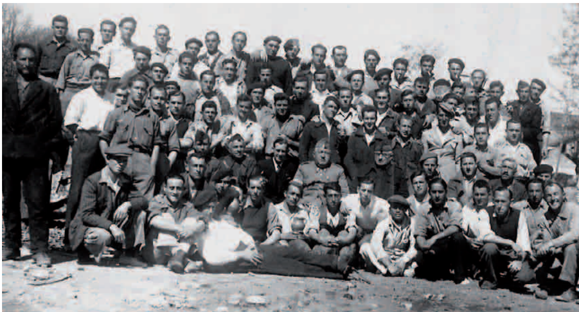
Ourense, badirudi langileen batailoitan jasandakoak eramangarriagoak izan zirela beste lurraldeetakoak baino. Bertako koruko kide izateak zerikusi zuzena izan zuen. 1939ko argazkia