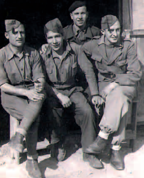
Algecirasen soldadutzan 1942ko otsailaren 12an