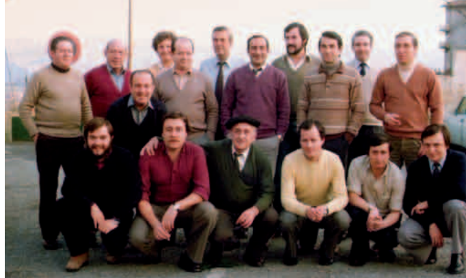
Erretiroa zela eta, lankideek Versalles jatetxean eginiko despedidan (1981-2-21)

rrren aldeko diru bilketa egin zuten. Uste baino diru gehiago bildu zuten. Erreteriarren poza ez zen nolana hikoia izan! Bai etxekoei laguntza apurra emateko, bai soldadutzak ekarriko zizkion gastuei aurre egiteko laguntza aparta, benetan.