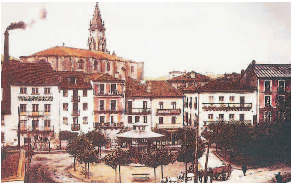
Errenteria xx. mendearen lehen hamarkadan: Errenteria, Euskal Herriko hainbat herriren antzera, gaurko jendetzaren laurdenera ez zen iristen xx. mendearen hasieran

ordu eta erdi pasa omen zuen eginikoari buruzko azalpenak ematen.