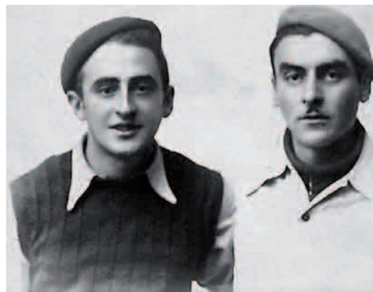
Xabierrek harreman onak izan zituen bere preso kideekin. Astorgan 1940ko urtarrilaren 1ean

Gurutze bide latza pasako du hortik aurrera. Laredoko hondartzara lehenik eta,