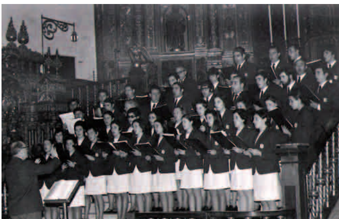
Oiartzungo Lartaun Abesbatzarekin 1970eko azaroaren 17an

Bien bitartean, beste edozein gazteren antzeko bizimodua egiten zuen. Egunez han-hemenka egin zezakeenaz gain, lagunekin batera gustura kantatzen zuen tabernetan eta joan-etorrietan.