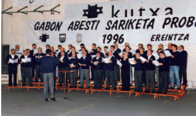
Gabon Abesti Sariketan Pakezaleak taldearekin 1996an Erreterian

rrren aldeko diru bilketa egin zuten. Uste baino diru gehiago bildu zuten. Erreteriarren poza ez zen nolana hikoia izan! Bai etxekoei laguntza apurra emateko, bai soldadutzak ekarriko zizkion gastuei aurre egiteko laguntza aparta, benetan.