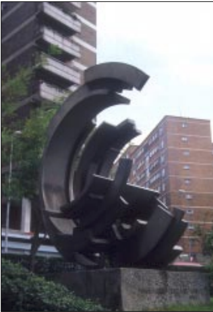
Formas Concéntricas 2 (1971) de Vicente Larrea.

En otros casos la escultura se integra en la fachada constituyendo un elemento que da vistosidad y elegancia al conjunto. Así por ejemplo las esculturas de Angel Garraza en el edificio de viviendas de Alameda San Mamés. En épocas anteriores también hay destacadas fachadas cuya escultura ha identificado al edificio como por ejemplo la Minerva de Ricardo Iñurría en el ático del Banco Hispano Americano. Consecuencia, en parte, de esta especial relación arquitectura-escultura es la preferencia que algunos arquitectos han mostrado por el trabajo de algún escultor para decorar las fachadas de sus edificios. Joaquín Lucarini, por ejemplo, realizó varias obras en edificios del arquitecto Pedro Ispizua: Ceres y Mercurio en Gran Vía, La Navegación y La Industria en Gran Vía 55 y 68, la Leona del edificio de oficinas de Botica Vieja, las figuras de Calle Buenos Aires y los reyes medievales en un edificio de Zabálburu.