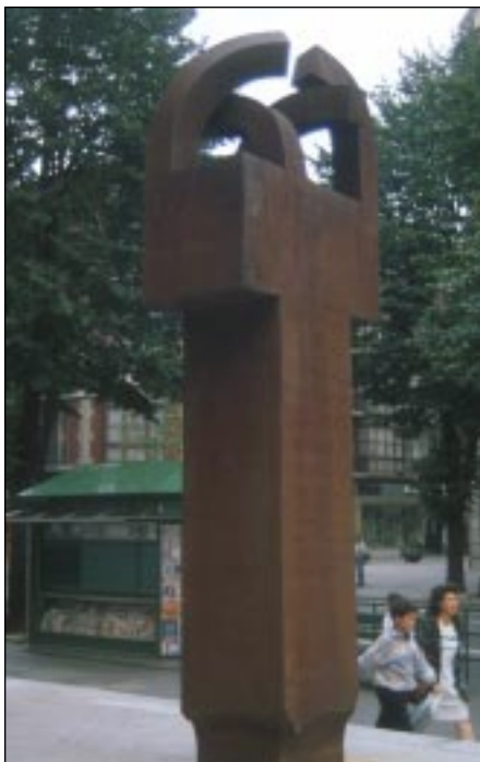
Elogio del hierro III (1997) de Eduardo Chillida.

Los interrogantes sobre el concepto de espacio público no terminan en una única identificación. Las matizaciones son muchas. La primera consideración nos remite a espacios que suelen ser abiertos, pero no únicamente a aquellos que se mojan con la lluvia. También están incluidos los que se encuentran en vestíbulos abiertos al público, es decir, los que son de uso público . Así, por ejemplo, las esculturas de la estación de ferrocarril o las de las escuelas que están a la vista sí las he tenido en cuenta aunque nunca vean el sol o la lluvia. De igual manera se pueden considerar las esculturas que se encuentran en la fachada de un edificio de propiedad o uso privado. En este sentido, lo mismo da que sea de una comunidad de vecinos, de una iglesia o de un banco, porque su visión sí es pública.