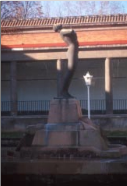
Homenaje a Arriaga (1933) de Paco Durrio.

El estudio está dividido en cuatro épocas marcadas por el cambio de siglo, el periodo de principios de siglo a la Guerra Civil, la Dictadura y la Democracia. Antes de 1900 el número de artistas que trabajaron, y consecuentemente el número de obras, fue pequeño. Únicamente podemos contar con 6 obras. Dos de Benlliure, la citada del fundador de Bilbao, la de Trueba (1895) de jardines de Albia, un tímpano en la iglesia de la Residencia, las esculturas de la fachada de la Quinta Parroquia y los de los frontones de la Universidad de Deusto. Como se puede comprobar la mayoría está vinculada a la arquitectura, aspecto que va a ser una constante en Bilbao. Sin embargo es un momento decisivo en la consolidación del Realismo en la escultura conmemorativa debido en gran medida al éxito de la obra de Mariano Benlliure primer escultor que alcanza la medalla de honor en la Exposición Nacional de 1905 2 . Este gusto por la descripción detallista se puede apreciar ya en sus primeras obras como la de Diego Lope fundador de la villa.