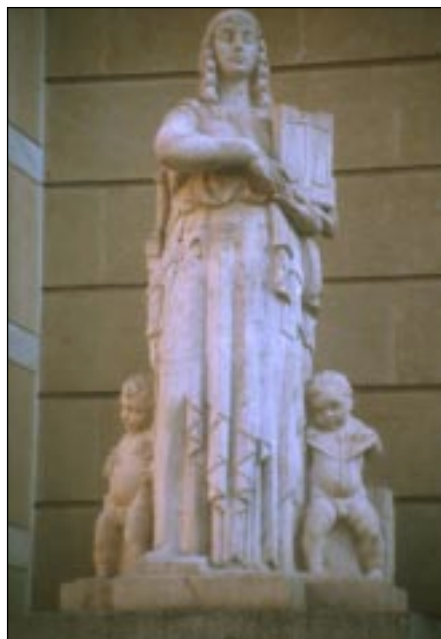
La Ley (años cuarenta) de Joaquín Lucarini.

las posibilidades económicas y las necesidades estético-funcionales invitaban constantemente a erigir nuevas estatuas 3 . Paralelamente se inicia una tendencia hacia el modernismo donde se combina la representación realista y la disolución de las formas buscando efectos más decorativos como en el monumento a Casilda Iturrizar (1906) de Agustín Querol en el parque que lleva su nombre. La más decidida renovación en este campo de la escultura vino de la mano de Paco Durrio ganador del proyecto de monumento a Juan Crisóstomo de Arriaga 4 en 1905, en clara conexión con las corrientes simbolistas de su tiempo. Este mismo espíritu se desprende en el Homenaje a Adolfo Guiard de Estanislao Segurola (1927)