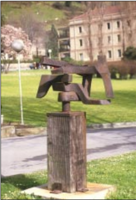
Homenaje a Icaza (1979) de Ramón Carrera.

Nuevas tendencias en la representación de los homenajeados empiezan a mostrarse desde los últimos años de la dictadura como el Homenaje a Icaza de José Ramón Carrera o el Homenaje a Unamuno en el patio del Instituto Central.