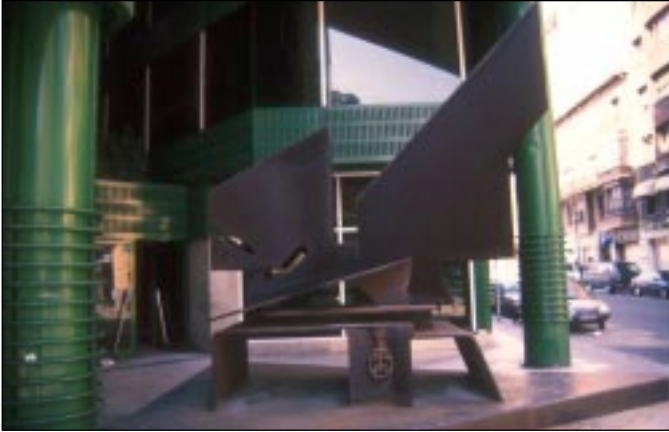
Sin título (1986) de Néstor Basterretxea.