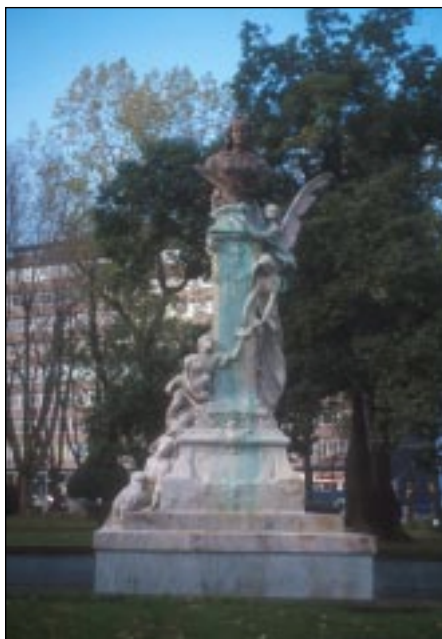
Doña Casilda Iturrizar (1906) de Agustín Querol Subirats.