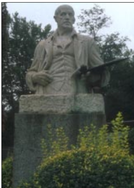
Ignacio Zuloaga (1947) de Julio Beobide.

Los lugares preferentes para ubicar las esculturas públicas fueron durante mucho tiempo el centro de las ciudades, y de estos las plazas y los jardines. Los ensanches y las nuevas planificaciones urbanas han modificado estos aspectos, dando protagonismo a otros lugares de las ciudades. Los jardines junto al museo de Bellas Artes son el marco de la escultura de Julio Beobide Ignacio Zuloaga (1947) mostrando en sus manos los atributos propios de su arte, y los de la calle Calixto Diez el busto del que fue alcalde de Bilbao Gregorio Balparda . Los jardines del Hospital de Basurto acogen numerosos bustos de hombres que promovieron su creación y desarrollo como Félix de Abásolo , Carmelo Gil Ibargoitia , Gregorio de la Revilla , Doctor Areilza . Las fachadas de las escuelas también acogen los bustos de aquellos que hicieron aportaciones decisivas para su fundación como el de Rivera Múgica en las escuelas de su mismo nombre.