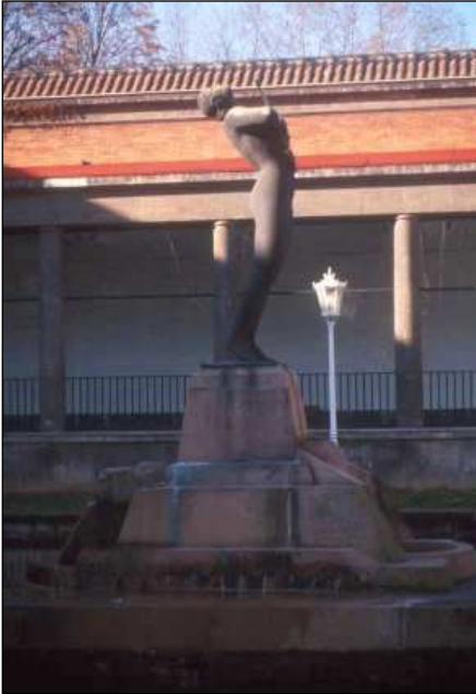
Homenaje a Arriaga (1933) de Paco Durrio.

El estudio está dividido en cuatro épocas marcadas por el cambio de siglo, el periodo de principios de siglo a la Guerra Civil, la Dictadura y la Democracia. Antes de 1900 el número de artistas que trabajaron, y consecuentemente el número de obras, fue pequeño. Únicamente podemos contar con 6 obras. Dos de Benlliure, la citada del fundador de Bilbao, la de Trueba (1895) de jardines de Albia, un tímpano en la iglesia de la Residencia, las esculturas de la fachada de la Quinta Parroquia y los de los frontones de la Universidad de Deusto. Como se puede comprobar la mayoría está vinculada a la arquitectura, aspecto que va a ser una constante en Bilbao. Sin embargo es un momento decisivo en la consolidación del Realismo en la escultura conmemorativa debido en gran medida al éxito de la obra de Mariano Benlliure primer escultor que alcanza la medalla de honor en la Exposición Nacional de 1895 2 . Este gusto por la descripción detallista se puede apreciar ya en sus primeras obras como la de Diego Lope fundador de la villa.