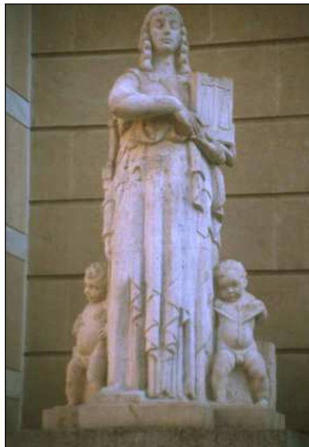
La Ley (años cuarenta) de Joaquín Lucarini.

las posibilidades económicas y las necesidades estético-funcionales invitaban constantemente a erigir nuevas estatuas 3 . Paralelamente se inicia una tendencia hacia el modernismo donde se combina la representación realista y la disolución de las formas buscando efectos más decorativos como en el monumento a Casilda Iturrizar (1906) de Agustín Querol en el parque que lleva su nombre. La más decidida renovación en este campo de la escultura vino de la mano de Paco Durrio ganador del proyecto de monumento a Juan Crisóstomo de Arriaga 4 en 1905, en clara conexión con las corrientes simbolistas de su tiempo. Este mismo espíritu se desprende en el Homenaje a Adolfo Guiard de Estanislao Segurola (1927)