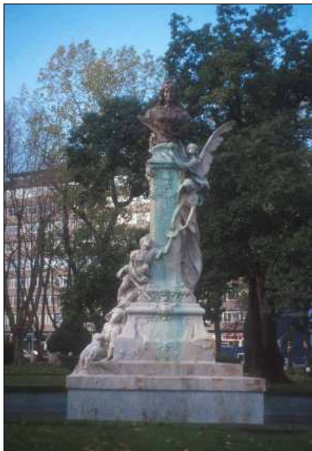
Doña Casilda Iturrizar (1906) de Agustín Querol Subirats.