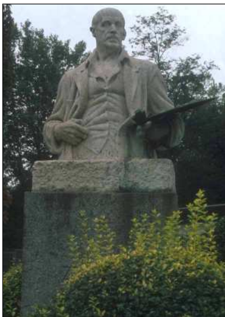
Ignacio Zuloaga (1947) de Julio Beobide.

Los lugares preferentes para ubicar las esculturas públicas fueron durante mucho tiempo el centro de las ciudades, y de estos las plazas y los jardines. Los ensanches y las nuevas planificaciones urbanas han modificado estos aspectos, dando protagonismo a otros lugares de las ciudades. Los jardines junto al museo de Bellas Artes son el marco de la escultura de Julio Beobide Ignacio Zuloaga (1947) mostrando en sus manos los atributos propios de su arte, y los de la calle Calixto Diez el busto del que fue alcalde de Bilbao Gregorio Balparda . Los jardines del Hospital de Basurto acogen numerosos bustos de hombres que promovieron su creación y desarrollo como Félix de Abásolo , Carmelo Gil Ibargoitia , Gregorio de la Revilla , Doctor Areilza . Las fachadas de las escuelas también acogen los bustos de aquellos que hicieron aportaciones decisivas para su fundación como el de Rivera Múgica en las escuelas de su mismo nombre.