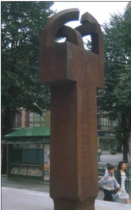
Elogio del hierro III (1997) de Eduardo Chillida.

Los interrogantes sobre el concepto de espacio público no terminan en una única identificación. Las matizaciones son muchas. La primera consideración nos remite a espacios que suelen ser abiertos, pero no únicamente a aquellos que se mojan con la lluvia. También están incluidos los que se encuentran en vestíbulos abiertos al público, es decir, los que son de uso público . Así, por ejemplo, las esculturas de la estación de ferrocarril o las de las escuelas que están a la vista sí las he tenido en cuenta aunque nunca vean el sol o la lluvia. De igual manera se pueden considerar las esculturas que se encuentran en la fachada de un edificio de propiedad o uso privado. En este sentido, lo mismo da que sea de una comunidad de vecinos, de una iglesia o de un banco, porque su visión sí es pública.