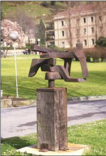
Homenaje a Icaza (1979) de Ramón Carrera.

Nuevas tendencias en la representación de los homenajeados empiezan a mostrarse desde los últimos años de la dictadura como el Homenaje a Icaza de José Ramón Carrera o el Homenaje a Unamuno en el patio del Instituto Central.