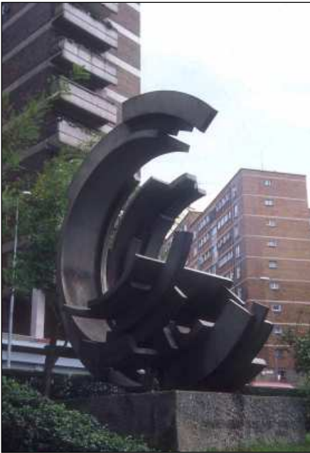
Formas Concéntricas 2 (1971) de Vicente Larrea.

En otros casos la escultura se integra en la fachada constituyendo un elemento que da vistosidad y elegancia al conjunto. Así por ejemplo las esculturas de Angel Garraza en el edificio de viviendas de Alameda San Mamés. En épocas anteriores también hay destacadas fachadas cuya escultura ha identificado al edificio como por ejemplo la Minerva de Ricardo Iñurría en el ático del Banco Hispano Americano. Consecuencia, en parte, de esta especial relación arquitectura-escultura es la preferencia que algunos arquitectos han mostrado por el trabajo de algún escultor para decorar las fachadas de sus edificios. Joaquín Lucarini, por ejemplo, realizó varias obras en edificios del arquitecto Pedro Ispizua: Ceres y Mercurio en Gran Vía, La Navegación y La Industria en Gran Vía 55 y 68, la Leona del edificio de oficinas de Botica Vieja, las figuras de Calle Buenos Aires y los reyes medievales en un edificio de Zabálburu.