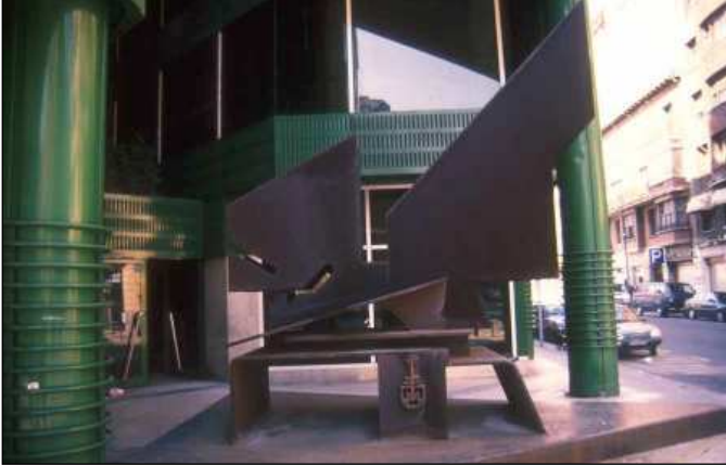
Sin título (1986) de Néstor Basterretxea.