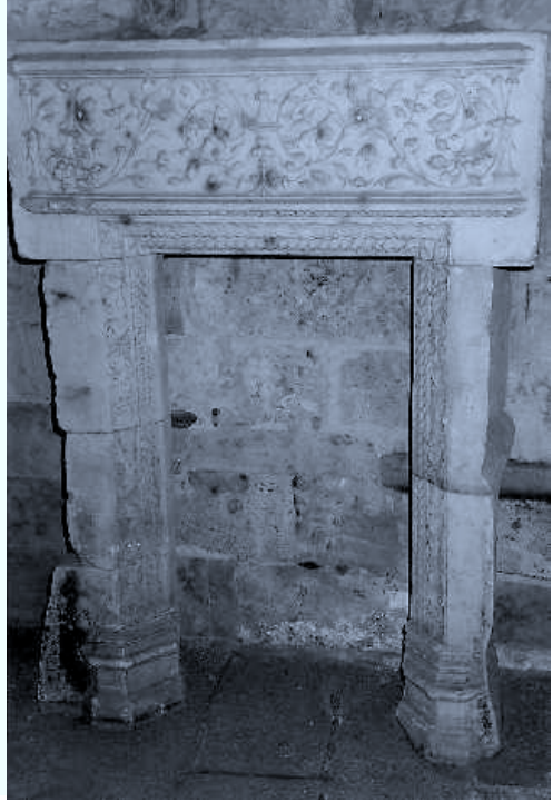
Único posible resto conservado del Colegio de Cuenca (Museo de Salamanca), fundado por el obispo de Cuenca don Diego Ramírez de Villaescusa.

Pedro de IBARRA, hijo de Juan de Alava, es un maestro ampliamente documentado, principalmente en tierras extremeñas, donde realizó su labor más importante, siendo maestro mayor de la orden de Alcántara y del obispado de Coria 48 . Queremos incluirle en esta relación de canteros vascos del primer tercio del siglo XVI en Salamanca, en primer lugar, por su probable nacimiento en esta ciudad a fines de la primera década del siglo. Fue parroquiano de Santa María de los Caballeros, donde figuran bautizados sus hijos con su primera mujer, Isabel de Salinas (Agustín –apadrinado por Machín de Sarasola–, María y Juan) 49 . Su primera aparición documental data de 1533 50 y por entonces formaría parte del equipo de “criados” de su padre. Sus obras más importantes en Salamanca son, en 1539-40, el palacio del conde de Monterrey, con Miguel de Aguirre y maese Pedro, siguiendo trazas de Rodrigo Gil y fray Martín de Santiago 51 . A partir de 1540 trabaja como destajero de la catedral, con Juan Negrete, Miguel de Aguirre y Diego de Vergara 52 ; al tiempo, se ocuparía de la ampliación de