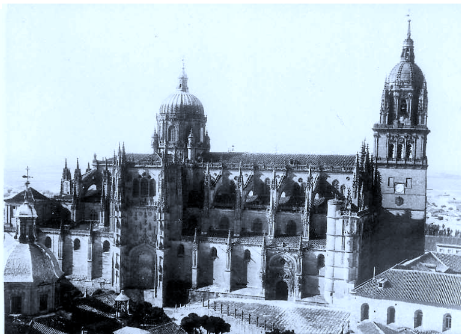
La Catedral Nueva. Iniciada en 1513 por Juan Gil, según trazas de los maestros Egas y Rodríguez, en su construcción vemos intervenir a muchos canteros vascos.

solían pasar la mayor parte de tiempo fuera de su solar de origen, para volver a él en invierno, época normalmente inactiva 4 .