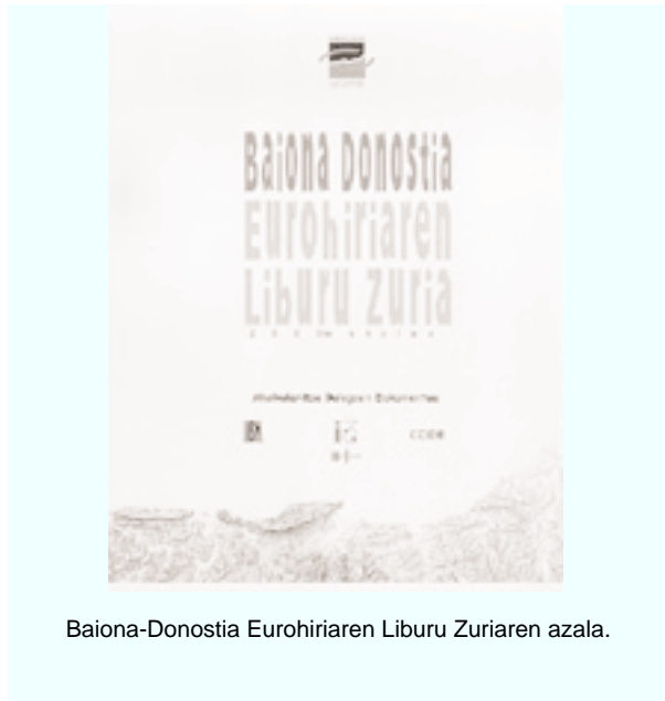
Baiona-Donostia Eurohiriaren Liburu Zuriaren azala.

Espainiako Erreina eta Frantziako Errepublika lurralde erakundearen arteko Lankidetzaren dinamismoaz jabeturik, bi aldeko harremanak aberastu eta Europaren eraikuntza indartzeko lankidetzak hori mantendu eta garatu nahian, eta lurralde kolektibitate edo agintarien arteko Mugaz Gaindiko Lankidetzarako 1980ko martxoaren 21eko Hitzarmen Marko Europarraren aplikazioa errazteko asmoz 38 , bi Estatuak lurralde erakundearen arteko Mugaz Gaindiko Lankidetzarako Baionako Ituna sinatzea erabaki zuten 1995eko martxoaren 10ean Baionan. Hitzarmen Markoa aplikatzeko 39 , eta horrenbestez, Mugaz Gaindiko Lankidetzak aurrera