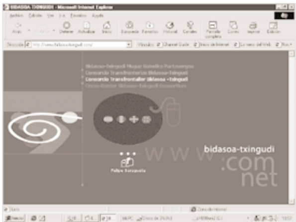
Bidasoa-Txingudi Mugaz Gaiarduko Partzuergoaren web orria ( www.bidasoa-txingudi.com ).