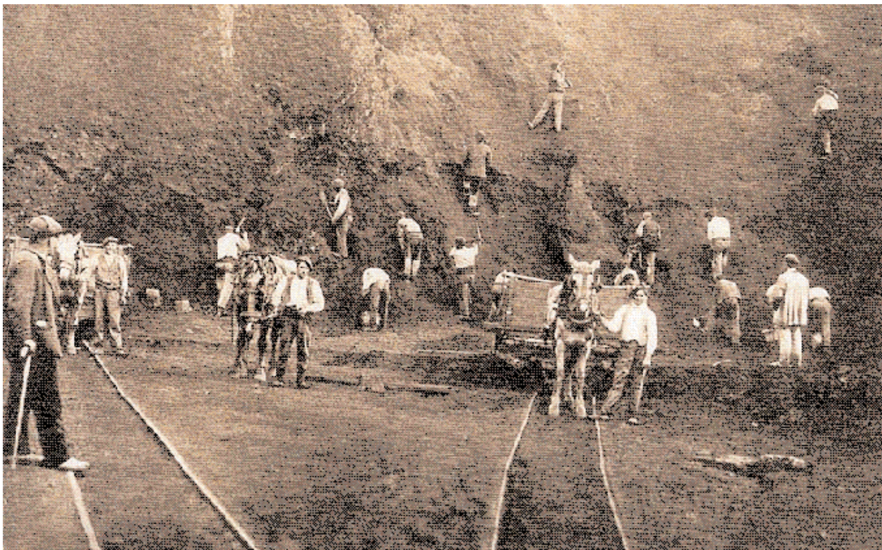
Kooperatibak eratzeko prozedurak ezaugarri berezi batzuk ditu.

beren jardueren lurralde esparrua. KAren esanetan, EAEk bakarrik izango zuen eskumena beren sozietate-jarduera tipikoa Erkidegoaren lurralde barruan gauzatzen zuten Kooperatiben gainean ( Laugarren Funts Juridikoa: Euskal Autonomia Erkidegoak beren sozietate-jarduera tipikoa gauzatzen duten kooperatibak legez arautzeko eskumena du... ). Ondorioz, gaur egun, Euskadiko Kooperatiben 4/1993 Legearen Bigarren Azken Xedapenak eta Kooperatiben Erregistroaren Araudiaren 47. artikulua ezarri dute Kooperatiba bati Euskadiko legedia aplikatzeko beharrezkoa dela sozietate-objektua zehazten duten lankidetzaren harremanak (hau da, Kooperatibak bere bazkideekin dituen harremanak) EAEan gauzatzea. Horrek guztiak, ordea, ez du galarazten Kooperatibak EAEko lurraldetik kanpo gainontzekoekin harreman juridikoak izatea edo bere sozietate-objektuarentzat osagarriak diren jardueren instrumental nahiz pertsonalak egitea.